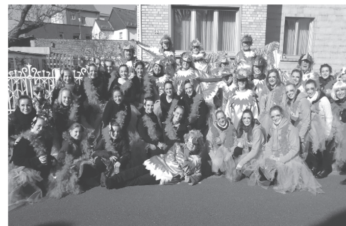
Die Flamingos und Paradiesvögel der GVL

Vorab freuen wir uns, Sie auf dem Fischerfest bei uns im und am Begegnungshaus begrüßen zu dürfen.