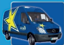
LIEFERUNG & MONTAGE